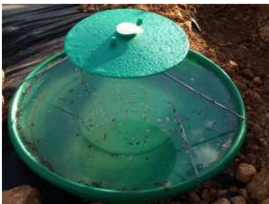
מלכודת ללכידה המונית

לניטור יש להציב מלכודת אחת לשני דונמים בבית הצמיחה ושתי מלכודות לדונם במשתלה. חשוב לבדוק את המלכודות לפחות אחת לשבוע. ללכידה המונית מציבים 2-5 מלכודות לדונם במבנה ובשטח הפתוח. את הנדיפית יש להחליף אחת ל-4-6 שבועות.